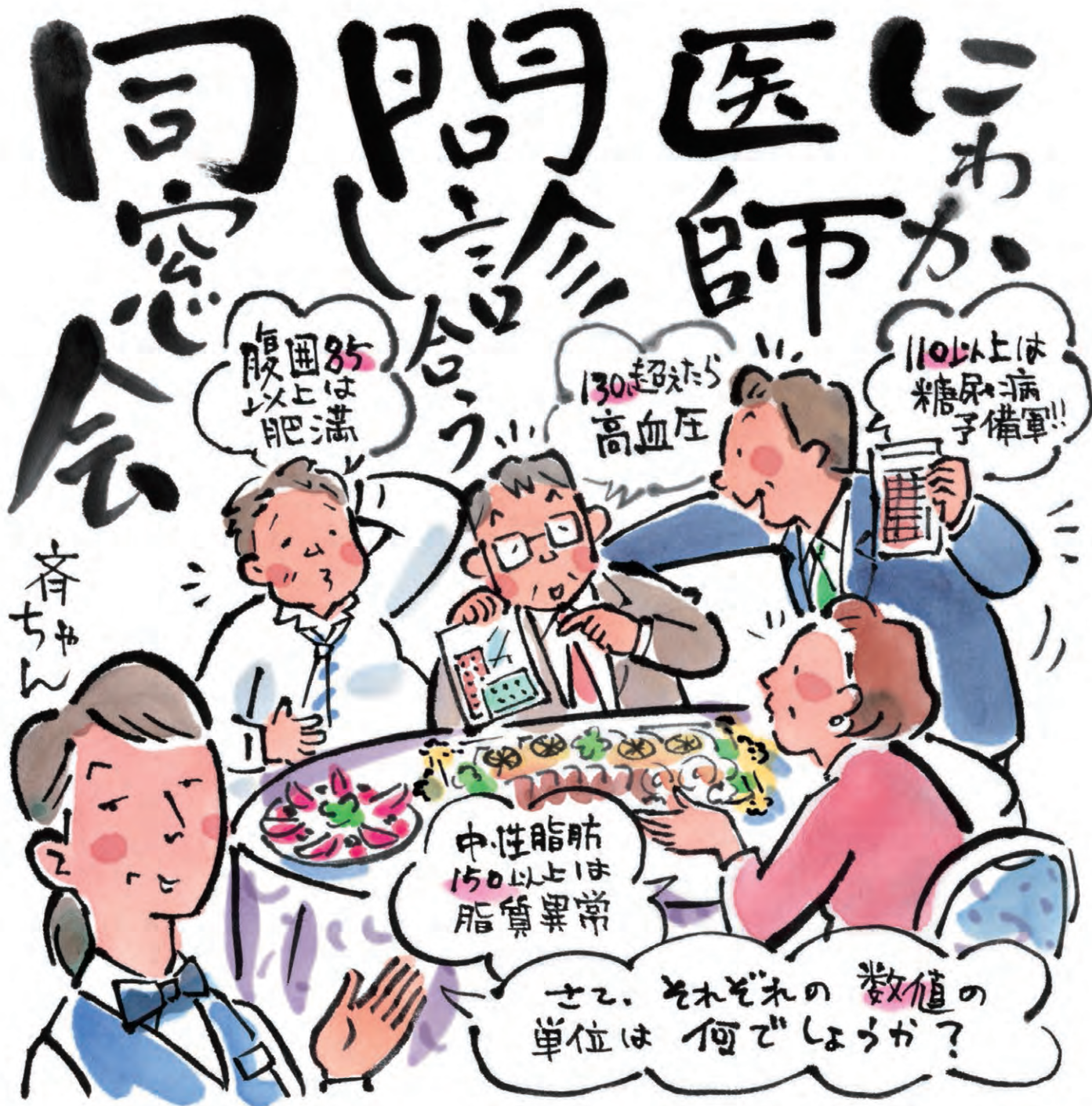
[答え] 脂質: 中性脂肪150mg/dL以上、HDLコレステロール40mg/dL未満 / 腹囲: 男性85cm以上、女性90cm以上 / 血圧: 最高130mmHg以上、最低85mmHg以上 / 血糖値: 空腹時110mg/dL以上